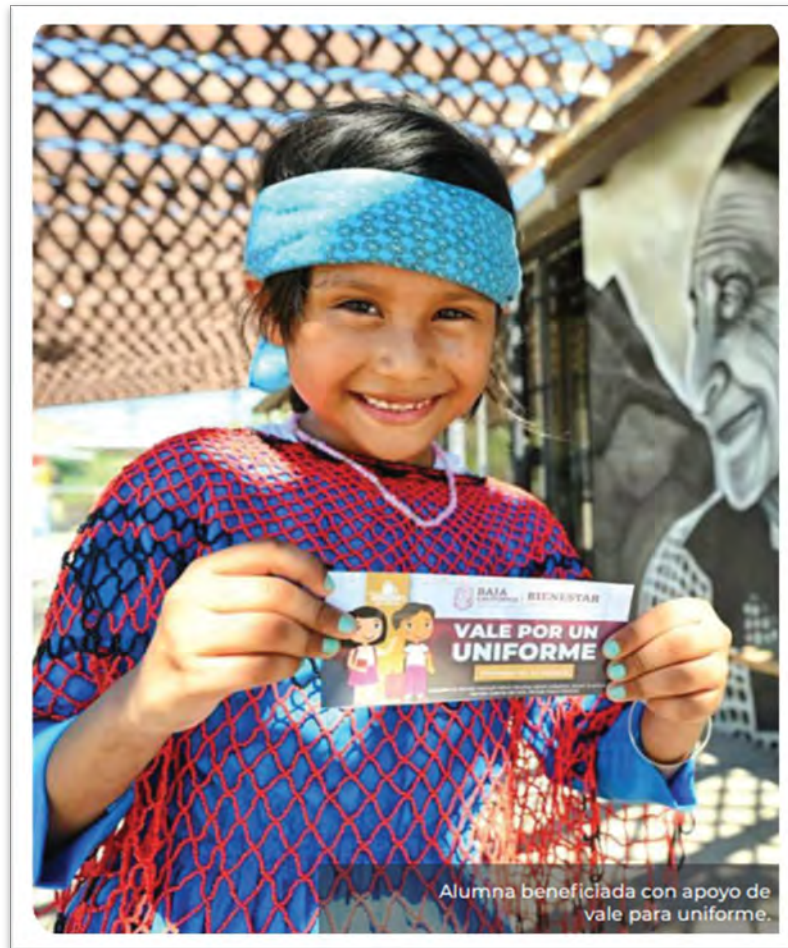
Alumna beneficiada con apoyo de vale para uniforme.

Secretaría de Bienestar del Estado. Primer Informe de Gobierno del Estado de Baja California, Bienestar para Todas y Todos.