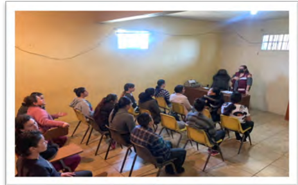
DIF Baja California. Plática del programa Escuela para las Familias, con el tema "Derechos de los NNA", Casa Miel, octubre de 2022, Ensenada, Baja California.