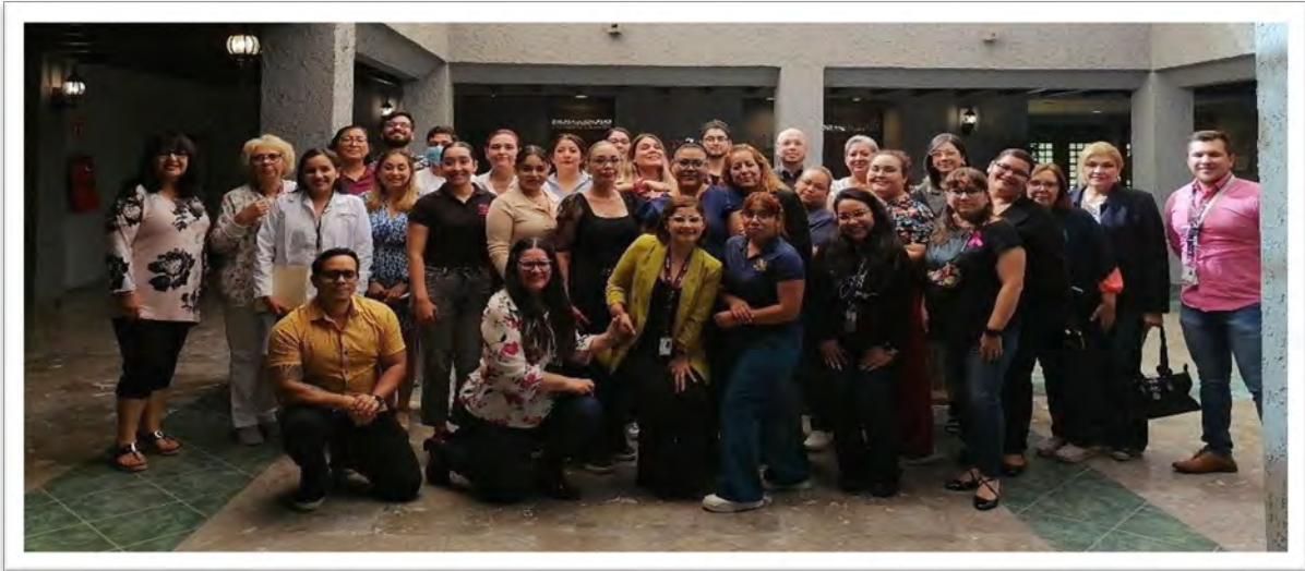
Secretaría de Salud del Estado. Capacitación a personal docente en materia de Educación Integral en Sexualidad, septiembre de 2022, Mexicali, Baja California.