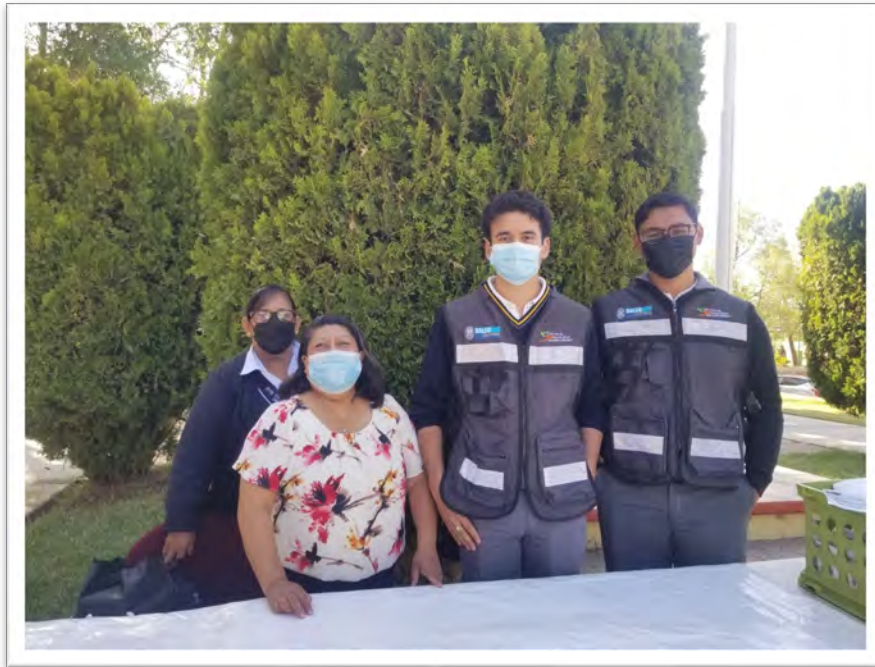
Secretaría de Salud del Estado. Promotores Juveniles Voluntarios del plantel educativo CETIS No. 25, Tecate Baja California, mayo de 2022.