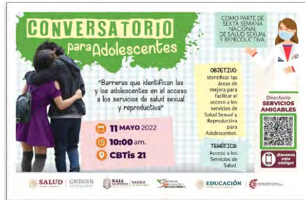
Secretaría de Salud del Estado. Convocatoria por parte del CNEGSR de la Sexta Semana de Salud Sexual y Reproductiva para Adolescentes en coordinación con DGETI, mayo de 2022.