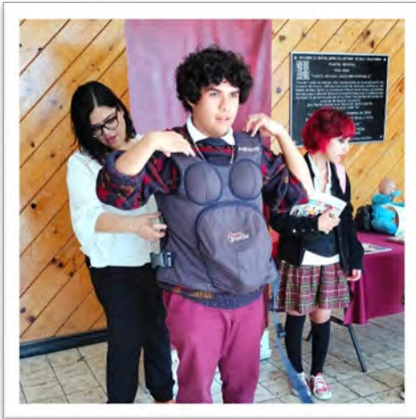
Instituto de la Juventud del Estado. Módulo de atención "Prevención del embarazo adolescente" en COBACH Plantel Mexicali, octubre de 2022, Mexicali, Baja California.