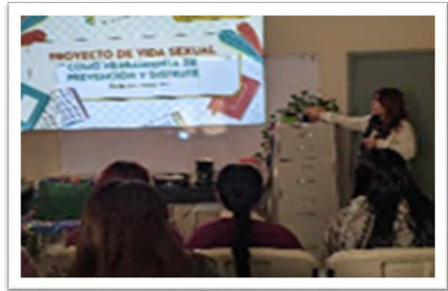
DIF Baja California. Niñas, niños y adolescentes en el Centro de Asistencia Social de Mexicali, noviembre de 2022, Mexicali, Baja California.