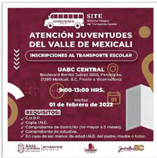
Instituto de la Juventud del Estado. Convocatoria para inscripciones al transporte escolar en Valle de Mexicali, enero de 2022.