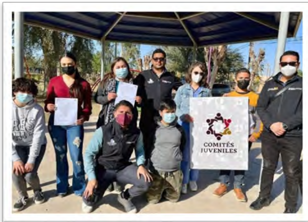
Instituto de la Juventud del Estado. Primer Comité Juvenil del Ejido Batáquez, febrero de 2022, Mexicali, Baja California.