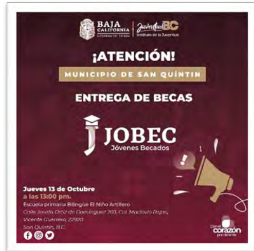
Instituto de la Juventud del Estado. Entrega de beca JOBEC, octubre de 2022, San Quintín, Baja California.