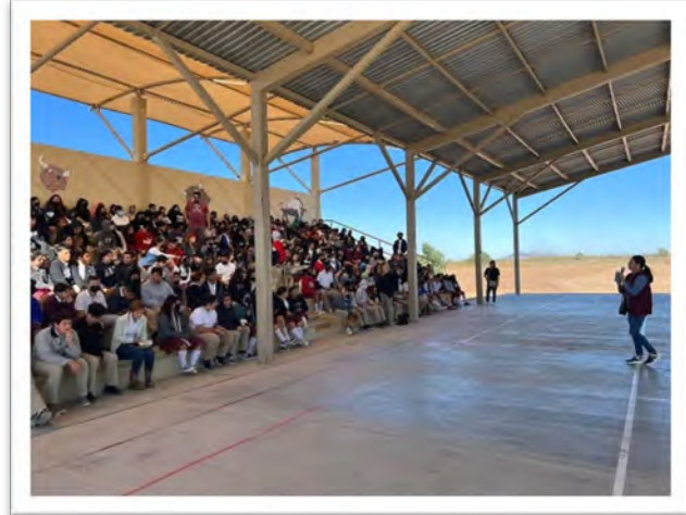
Instituto de la Juventud del Estado. Plática sobre sexualidad "Violencia 0" en COBACH Plantel Nayarit, octubre de 2022, Mexicali, Baja California.