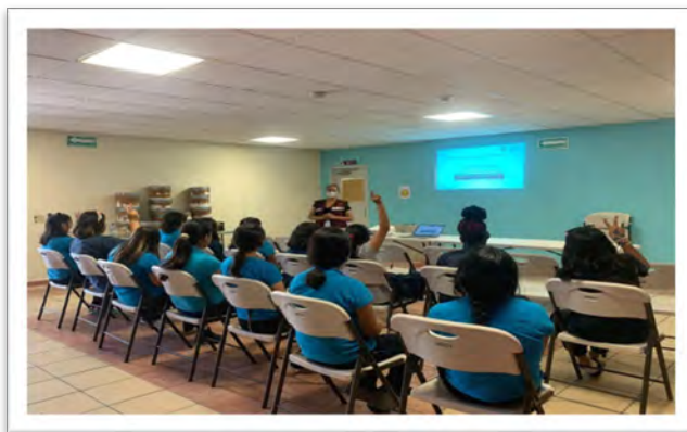
DIF Baja California. Conferencia del programa Pláticas de Frente con el tema "Derechos de la NNA", Albergue Temporal DIF Tijuana", septiembre de 2022, Tijuana, Baja California.