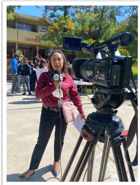
Secretaría de Salud del Estado. Difusión por parte de la responsable del Servicio Amigable de Tecate, con motivo de la Sexta Semana de Salud Sexual y Reproductiva para Adolescentes, en coordinación con DGETI y SSA, mayo de 2022, Tecate Baja California.