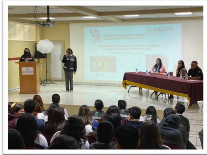
Secretaría de Salud del Estado. Conversatorio "Atención a la Violencia Sexual", CETiS 25, Tecate, Baja California, mayo de 2022.