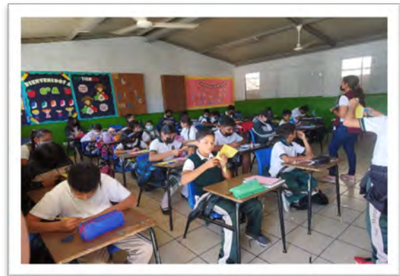
DIF Baja California, Plática del programa Taller Infantil con el tema "Derechos de los NNA", Primaria Escudo Nacional, septiembre de 2022, Tijuana, Baja California.