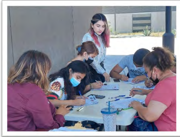
Instituto de la Juventud del Estado. Recolección de documentos para el programa de Becas JOBEC, agosto de 2022, Tijuana, Baja California.