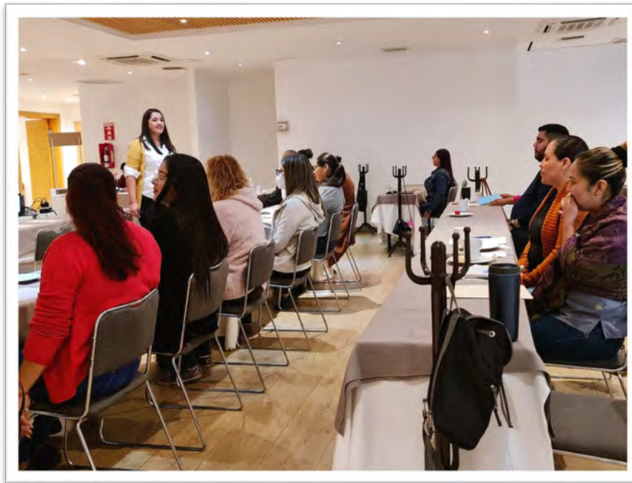
Secretaría de Salud del Estado. Capacitación a personal docente en materia de educación integral en sexualidad, septiembre de 2022, Tijuana, Baja California.