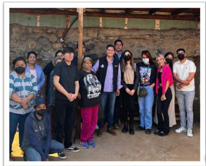
Instituto de la Juventud del Estado. Primer Comité Juvenil en la historia de las colonias Jesús Munguía y Revolución, del Distrito 16, Ensenada, Baja California, junio de 2022.