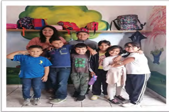
DIF Baja California. Plática del programa Taller Infantil con el tema Derechos de los NNA, Estancia infantil Mi Granjita, octubre de 2022, Ensenada, Baja California.