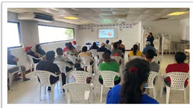
DIF Baja California. Plática del programa Escuela para las Familias con el tema "Cómo hablar de sexualidad con nuestros NNA", Centro Integrador para el Migrante Carmen Serdán, mayo de 2022, Tijuana, Baja California.