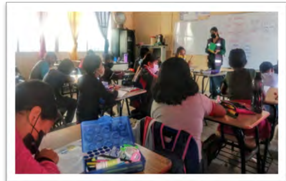
DIF Baja California. Plática del programa Taller Infantil con el tema "Derechos de los NNA", Primaria Josefa Ortiz de Domínguez, octubre de 2022, San Quintín, Baja California.