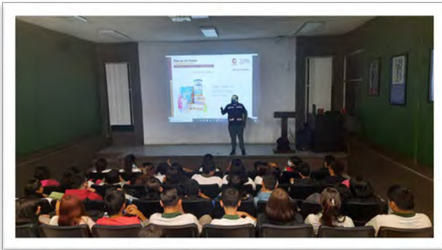
DIF Baja California. Conferencia del programa Pláticas de Frente con el tema "Prevención del embarazo", Plantel Conalep I, septiembre de 2022, Mexicali, Baja California.